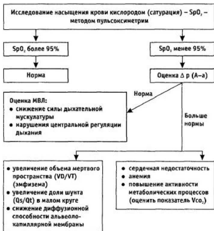
Рис. 2. Алгоритм диагностики причин гипоксемии